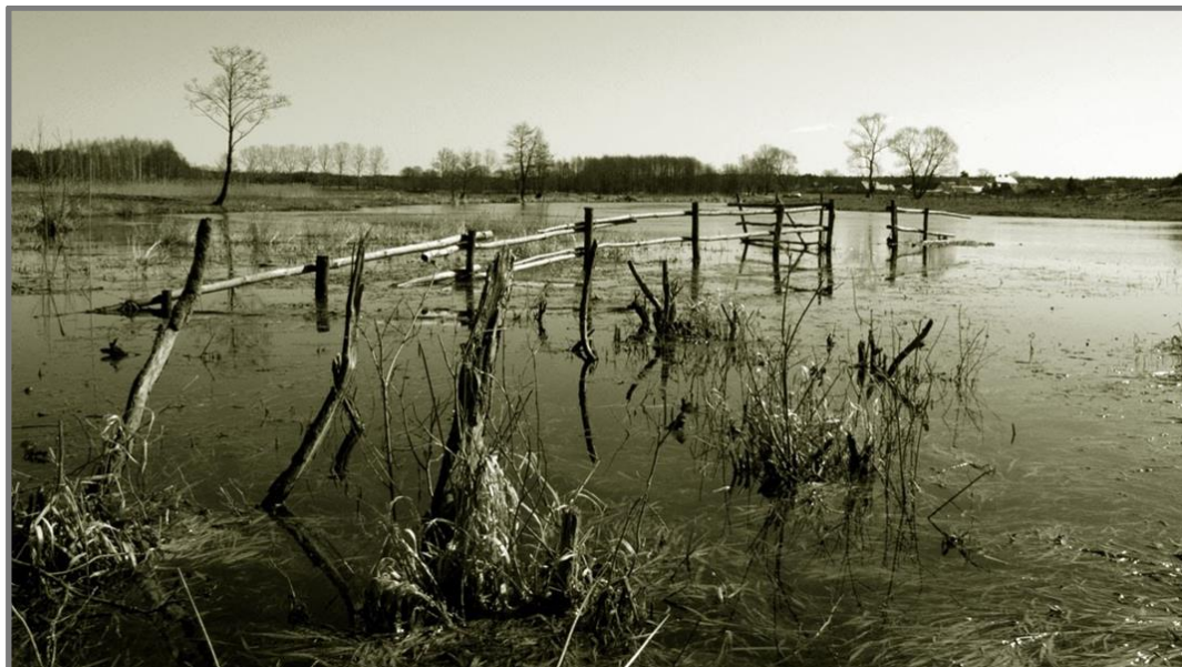
Вид на село Винценту из-за Писсы в апреле 2004 года. В 1939 году слева от села за рекой была Восточная Пруссия, справа Белостокская область Советского Союза 2

германско-советскому договору о дружбе и границе теперь была Область Государственных интересов Германии. Вид из-за Писсы на село Винценту, которое два года с 1939 года ненадолго стало советским на снимке ниже.